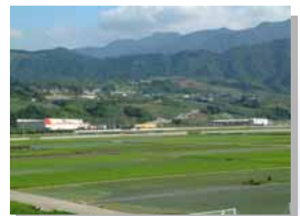
市川三郷町大塚地区工業団地