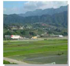
市川三郷町大塚地区工業団地